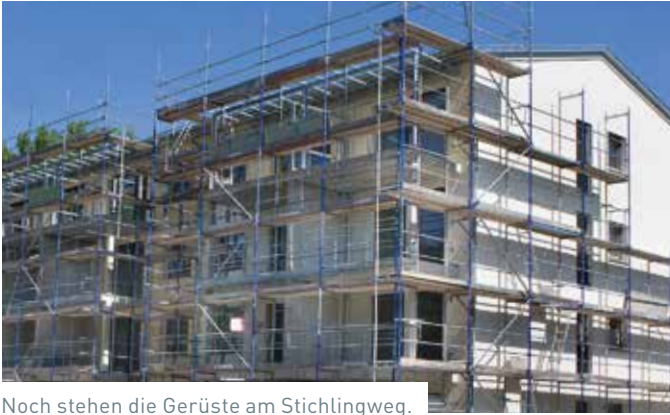
Noch stehen die Gerüste am Stichlingweg.

die Rohbauarbeiten. Die SWSG errichtet in Weilimdorf 32 Wohnungen. Zehn der Zwei- bis Vier-Zimmer-Wohnungen werden als Sozialwohnungen, sechs weitere nach dem kommunalen Programm „Mietwohnungen für mittlere Einkommensbezieher“ gefördert sein. Mitte 2019 sind die Gebäude fertig.