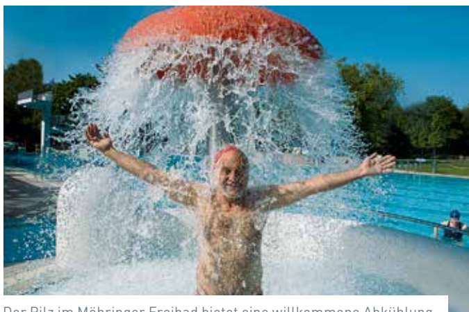
Der Pilz im Möhringer Freibad bietet eine willkommene Abkühlung.

Höhenfreibad Killesberg . Beim Höhenfreibad 37 . 70192 Stuttgart . Tel.: 0711 216-66250 . info.bbs@stuttgart.de www.stuttgart.de/baeder