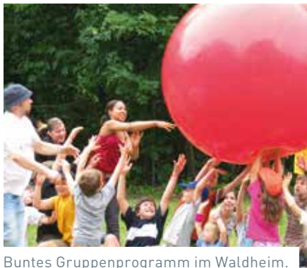
Buntes Gruppenprogramm im Waldheim.

Heller: Das Waldheim beginnt jeden Morgen um 8:30 Uhr und endet um 18:00 Uhr. Die Kinder fahren morgens mit Sonderbussen, die von unseren Betreuern begleitet werden, ins Waldheim. Als Erstes gibt es eine Begrüßung und der Tag beginnt mit einem gemeinsamen Frühstück. Danach findet das Gruppenprogramm