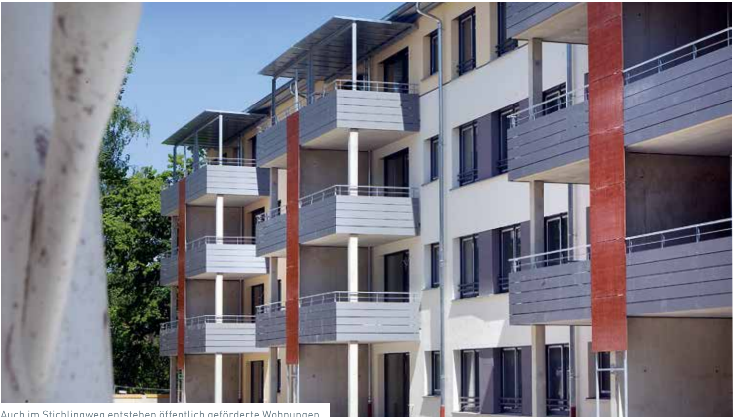
Auch im Stichlingweg entstehen öffentlich geförderte Wohnungen.