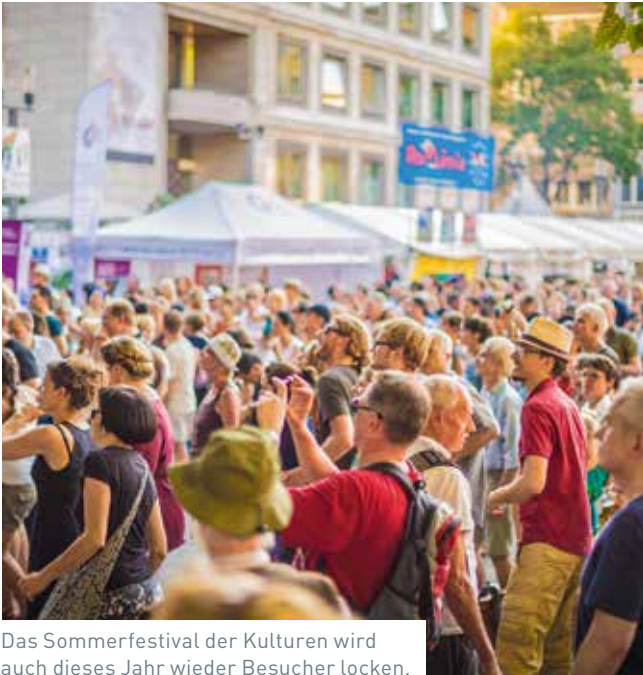
Das Sommerfestival der Kulturen wird auch dieses Jahr wieder Besucher locken.