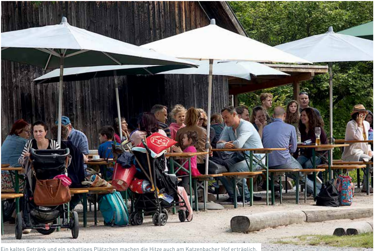
Ein kaltes Getränk und ein schattiges Plätzchen machen die Hitze auch am Katzenbacher Hof erträglich.