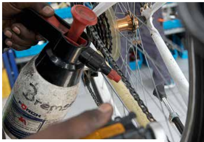
Die Kette schmieren ist eine der leichtesten Übungen.

beiliegender Anleitung den Flicker aufkleben. Vor dem Einbau kurz überprüfen, ob der Flicker wirklich dicht hält. Es lohnt sich, einfache Reifenheber zum Einpassen von Schlauch und Mantel zu kaufen.