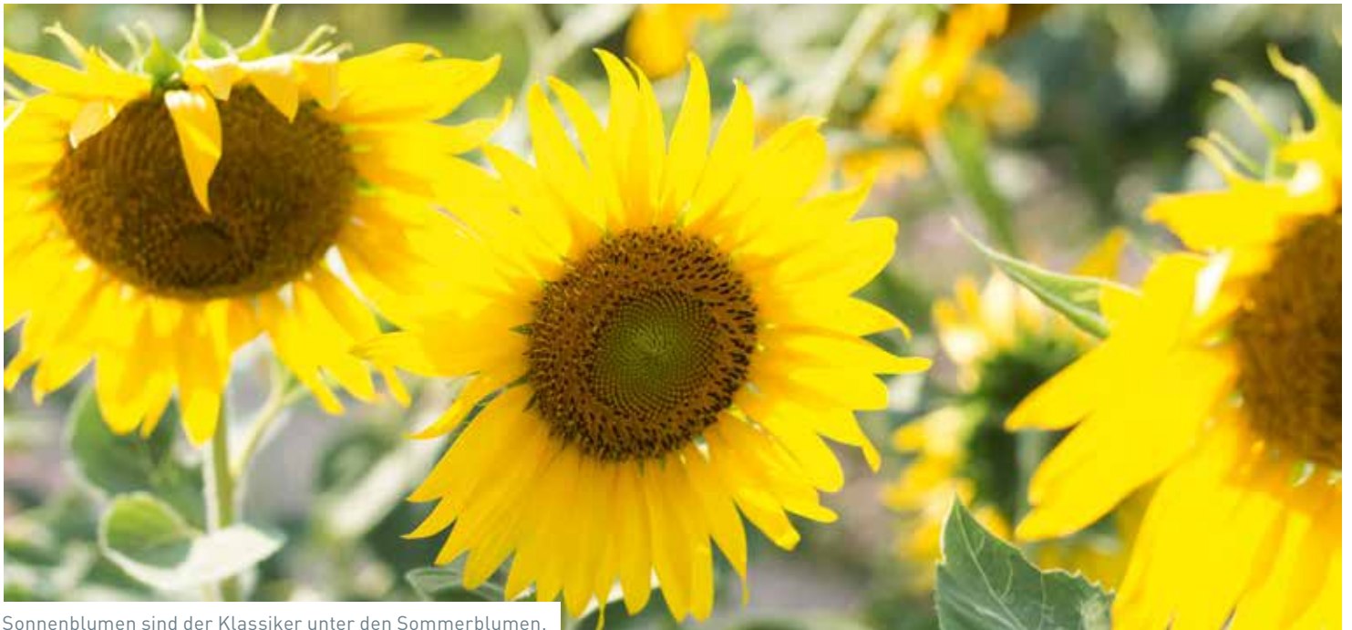
Sonnenblumen sind der Klassiker unter den Sommerblumen.