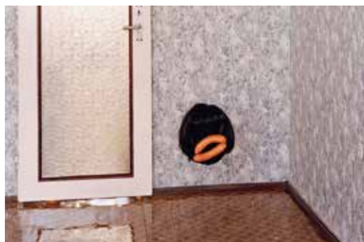
Der Kunstverein Gästezimmer stellt in Botnang aus.

Während einer Zwischennutzung des Kunstvereins Gästezimmer zeigen ab dem 4. Juli in einem Ladengeschäft der neuen Ortsmitte (Griegstraße 2) im schnellen Wechsel Künstler ihre Werke. Nach Malerei- und Multimedia-Projekten endet die Zwischennutzung Ende Juli mit vier künstlerischen Positionen aus den Bereichen Fotografie, Video und Skulptur.