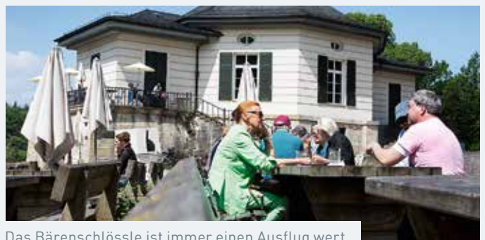
Das Bärenschlössle ist immer einen Ausflug wert.

Sicherlich zu den schönsten Zielen gehört die Stuttgarter Wilhelma! Hier werden nicht nur Freunde wilder Tiere begeistert sein, sondern auch alle Insekten-Fans und Botaniker. Die Wilhelma bietet mit ihren Gärten und dem Streichelzoo ein tagesfüllendes Ausflugsziel für jeden Geschmack in Bad Cannstatt.