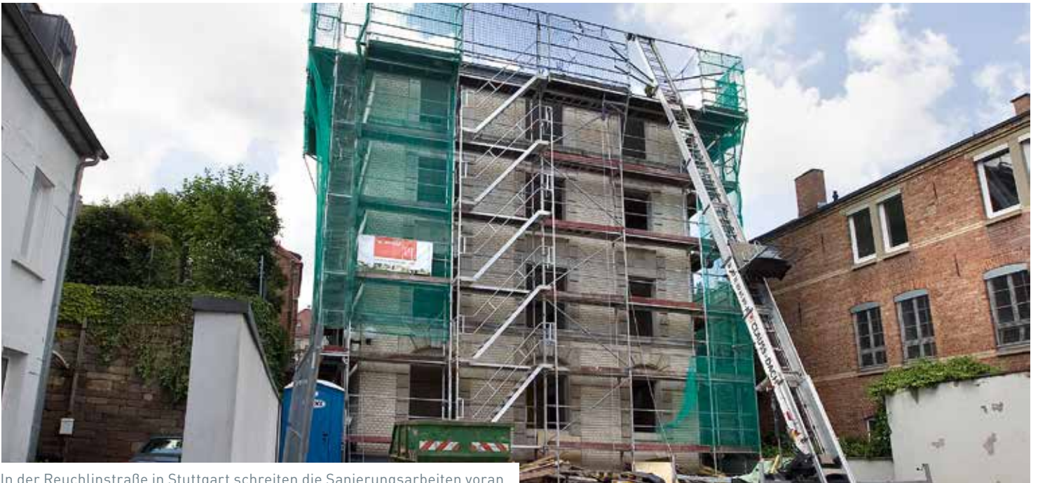
In der Reuchlinstraße in Stuttgart schreiten die Sanierungsarbeiten voran.