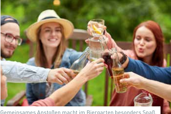
Gemeinsames Anstoßen macht im Biergarten besonders Spaß.