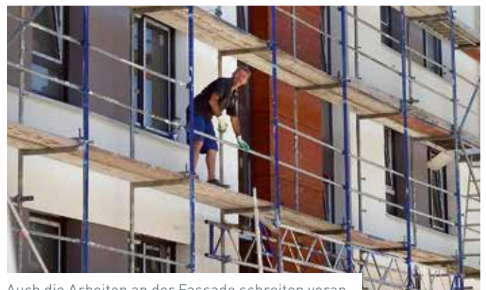
Auch die Arbeiten an der Fassade schreiten voran.

In der Zazenhäuser Straße ist die Wärmedämmung an der Fassade angebracht, die Balkone und die Treppen bekommen bald die endgültigen Geländer, auch die Straße ist bis auf die Deckschicht fertig gebaut. Als nächster Schritt wird der Estrich verlegt. 79 Mietwohnungen entstehen in Zuffenhausen, 27 davon sind öffentlich gefördert, 14 nach dem kommunalen Programm „Mietwohnungen für mittlere Einkommensbezieher“. Bis zum Herbst 2018 wächst die Wohnfläche von einst 1.100 auf 5.800 Quadratmeter an.