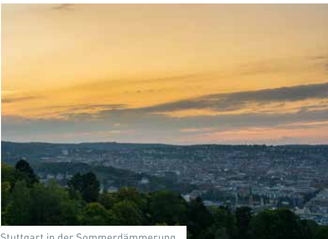
Stuttgart in der Sommerdämmerung.

Sich von der Sonne verwöhnen lassen und dabei auch kulinarisch genießen – das kann man in den Biergärten in und um die Stadt. Bei einem erfrischenden Getränk und gutbürgerlichem Essen kann man es durchaus aushalten. Ob man eine kleine Wanderung macht oder ganz bequem direkt anreist, das kann jeder für sich entscheiden. Auf ein kühles Getränk sowie eine Stärkung einzukehren, ist sicherlich nie verkehrt. Damit Sie nicht lange überlegen müssen, welchen Sie besuchen, und dabei durstig bleiben, haben wir hier einige Vorschläge.